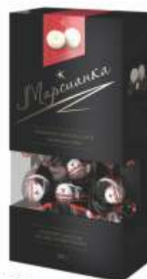
Марсианка «Кокосовый пудинг»