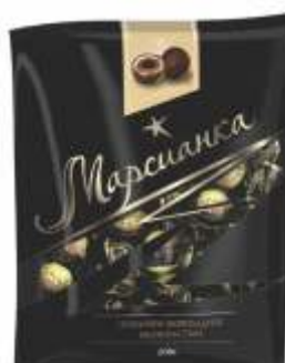
Марсианка «Три шоколада»