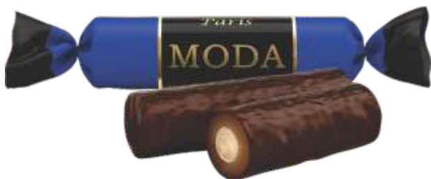
МОДА «Париж» Сливочный вкус