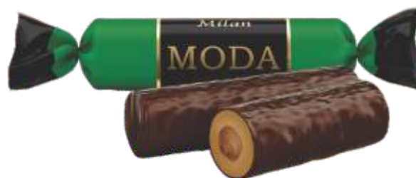
МОДА «Милан» Бисквитный вкус