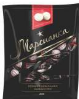
Марсианка «Кокосовый пудинг»