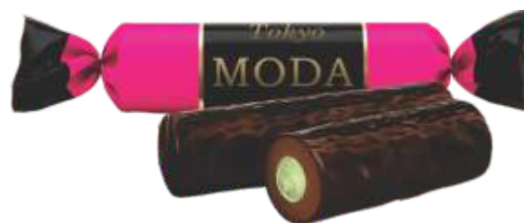
МОДА «Токио» Фисташковый вкус