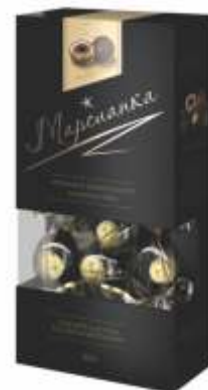
Марсианка «Три шоколада»