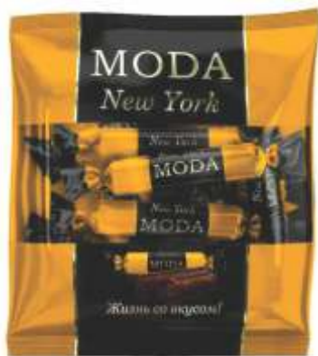
МОДА «Нью Йорк»