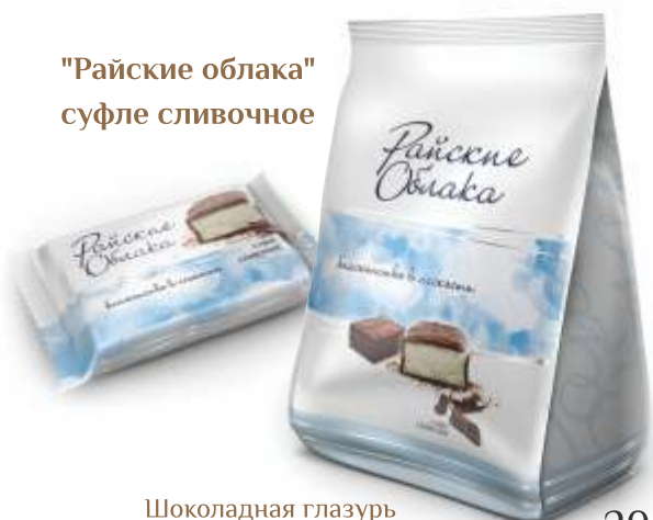
"Райские облака" суфле сливочное

Нежнейшее суфле с разнообразными вкусами, покрытое шоколадной глазурью. Суфле «Райские облака» производится с добавлением натурального сливочного масла и высококачественного сгущенного молока.