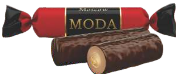
МОДА «Москва» Арахисовый вкус