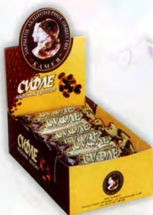
Суфле «Кофейный аромат»

Флоу-пак, масса нетто 22 г Шоу-бокс 24 шт.