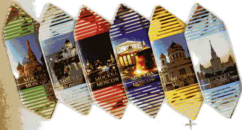
Трюфель ЭКСТРА + «Виды Москвы»