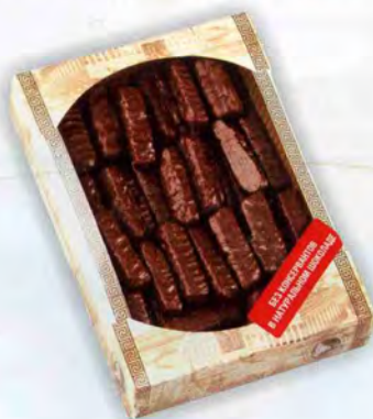
Вафельные конфеты (ассорти) «Мачо» «Золотой раджа» «Самурай»