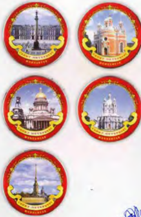
Монпансье ассорти фруктовое Виды Санкт-Петербурга

Жестяная банка Масса нетто 60 г Срок годности — 6 месяцев