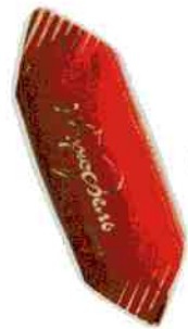
Трюфель ЭКСТРА + «Стандарт»

Шоколадно-кремовая начинка с добавлением коньяка в натуральной шоколадной глазури. Срок годности 4 месяца.