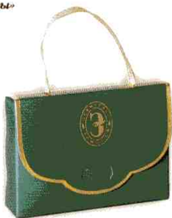
Трюфель ЭКСТРА + «Эрмитаж» Портфельчик

Масса нетто 190 г Срок годности — 4 месяца