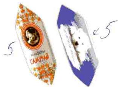
«Самурай», «Полярный мишка»

Шоколадно-вафельные конфеты с ореховой начинкой с добавлением корицы в натуральной шоколадной глазури. Срок годности — 4 месяца