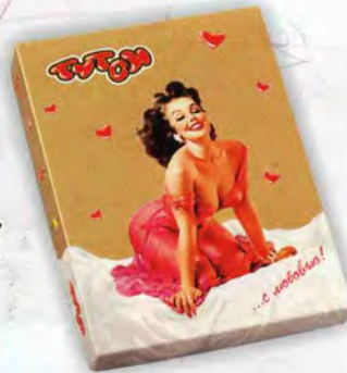
Трюфель ЭКСТРА ПЛЮС «Тутси»