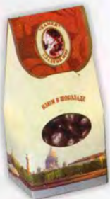
Изом в шоколаде