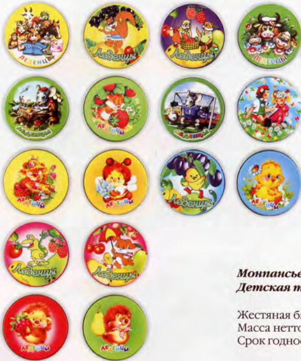
Монпансье ассорти фруктовое Детская тематика

Жестяная банка Масса нетто 60 г Срок годности — 6 месяцев