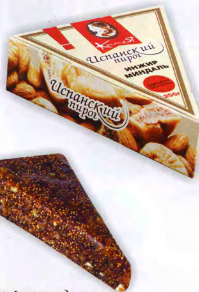
Из инжира с миндалем

Масса нетто 200 г Упаковка: вакуумная упаковка, картонная коробка