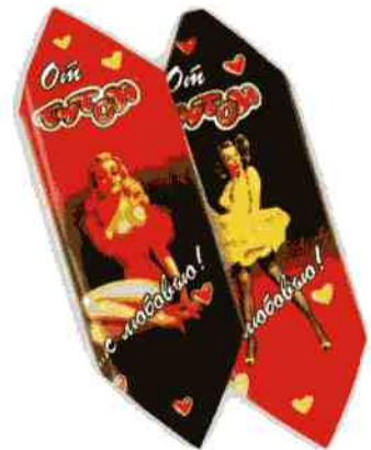
Трюфель ЭКСТРА + «Тутси»