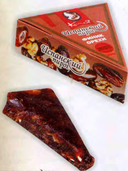
Из финика с миндалем

Масса нетто 200 г Упаковка: вакуумная упаковка, картонная коробка