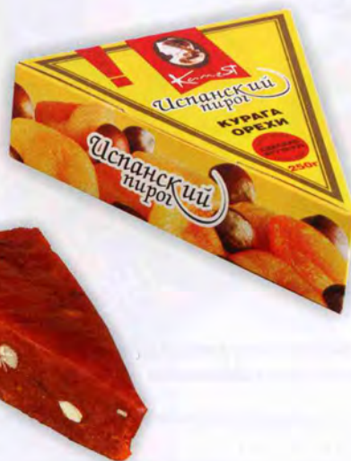
Из кураги с миндалем

Масса нетто 200 г Упаковка: вакуумная упаковка, картонная коробка