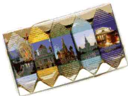
Трюфель ЭКСТРА + «Виды Москвы»

Масса нетто 190 г Срок годности — 4 месяца