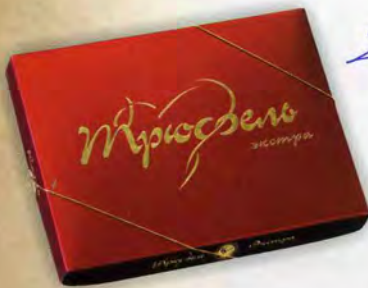
Трюфель ЭКСТРА ПЛЮС