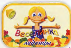
«Веселинка» Монпансье ассорти фруктовое в лимонно-сахарной обсытке

Коробка пластиковая Масса нетто 200 г Срок годности — 6 месяцев