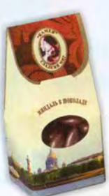
Миндаль в шоколаде