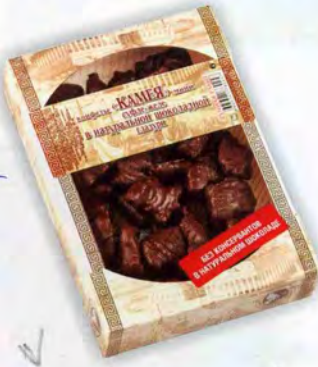
Желе-суфле в шоколаде (мини)