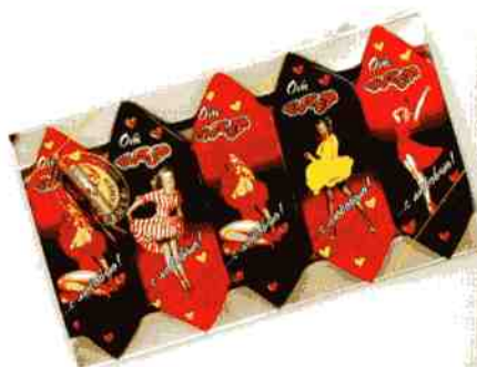
Трюфель ЭКСТРА + «Тутси»

Масса нетто 190 г Срок годности — 4 месяца