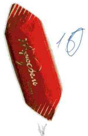
Трюфель ЭКСТРА + «XL»

Конфеты укрупненной формы. Шоколадно-кремовая начинка с добавлением коньяка в натуральной шоколадной глазури. Срок годности 4 месяца.