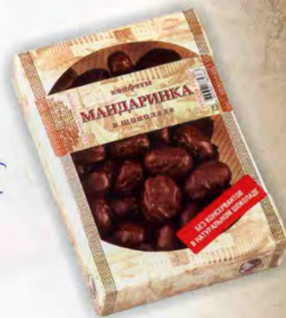
Мандаринка в шоколаде

Масса нетто 400 г Срок годности — 4 месяца