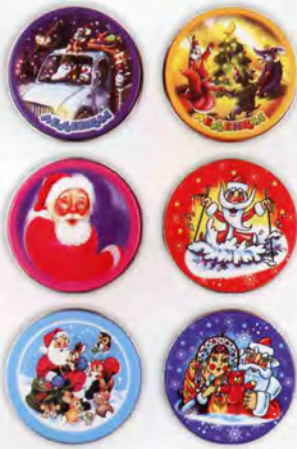
Монпансье ассорти фруктовое Новогодняя тематика

Жестяная банка Масса нетто 60 г Срок годности — 6 месяцев