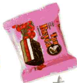
«Три вкуса» Ассорти (цитрус, персик, клюква)

Трехслойная начинка из суфле, желе и бисквита в натуральной шоколадной глазури. Срок годности — 3 месяца