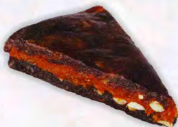
Ассорти (финик/чернослив/курага с миндалем)

Масса нетто 200 г Упаковка: вакуумная упаковка, картонная коробка