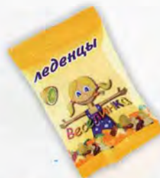
«Веселинка» Монпансье ассорти фруктовое в лимонно-сахарной обсытке

Жестяная банка Масса нетто 65 г Срок годности — 6 месяцев