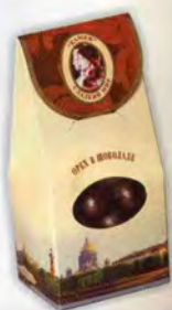
Орех в шоколаде