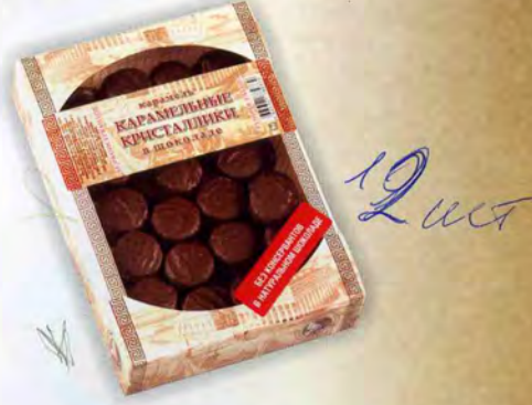
Карамельные кристаллики в шоколаде