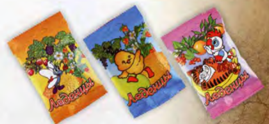
Монпансье ассорти фруктовое

П/п пакет Масса нетто 50 г Срок годности — 6 месяцев