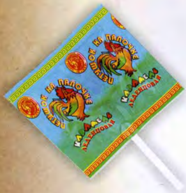
Петушок на палочке

Масса нетто 10 г Срок годности — 6 месяцев