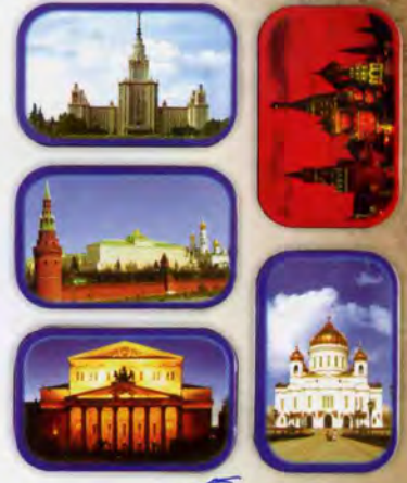
Монпансье ассорти фруктовое Виды Москвы

Масса нетто 60 г Срок годности — 6 месяцев