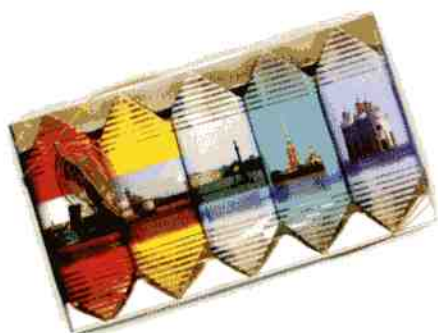
Трюфель ЭКСТРА + «Виды Санкт-Петербурга»

Масса нетто 180 г Срок годности — 4 месяца