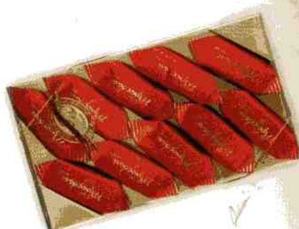
Трюфель ЭКСТРА + «Стандарт»

Масса нетто 180 г Срок годности — 4 месяца