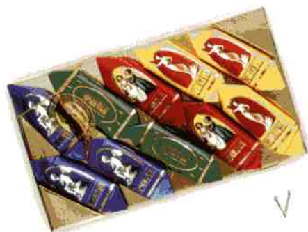
Трюфель ЭКСТРА + «Эрмитаж»

Масса нетто 180 г Срок годности — 4 месяца