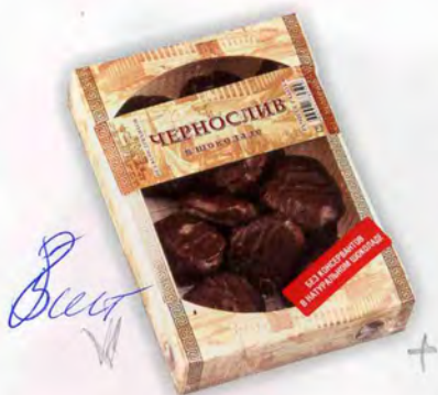
Чернослив укрупненный в шоколаде

Масса нетто 400 г Срок годности — 4 месяца