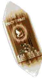
Трюфель ЭКСТРА + «Ресторан»