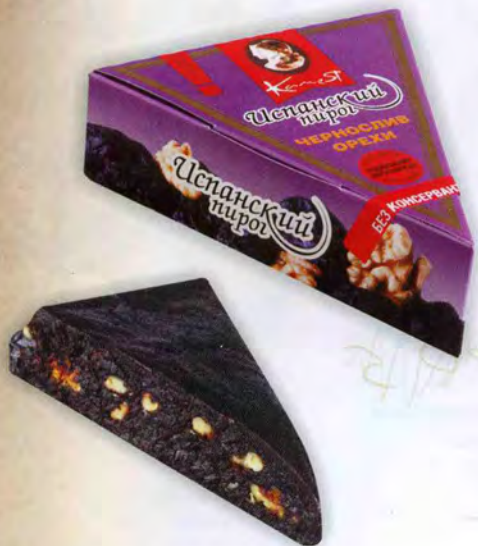
Из чернослива с грецким орехом

Натуральный продукт из прессованных сухофруктов и орехов без добавления сахара.