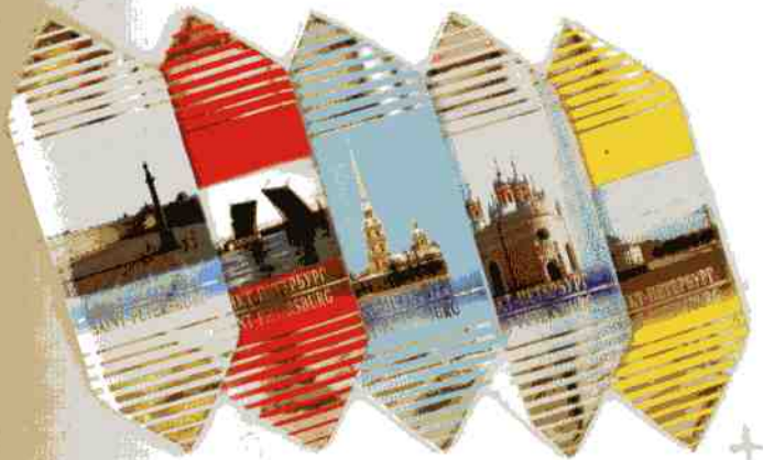
Трюфель ЭКСТРА + «Виды Санкт-Петербурга»

Шоколадно-кремовая начинка с добавлением коньяка в натуральной шоколадной глазури. Срок годности 4 месяца.