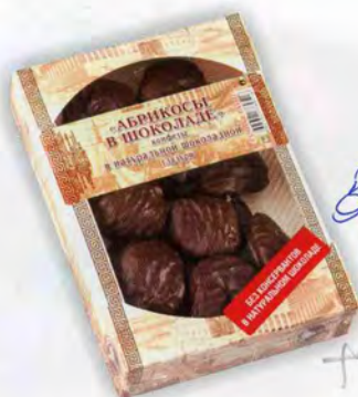
Абрикос укрупненный в шоколаде

Масса нетто 400 г Срок годности — 4 месяца