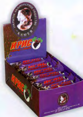
«Ирис сливочный с изюмом в шоколаде»

Флоу-пак, масса нетто 22 г Шоу-бокс 24 шт.