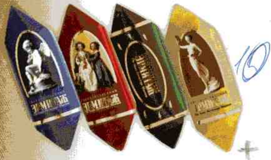
Трюфель ЭКСТРА + «Эрмитаж»

Нежные конфеты с исключительно богатым насыщенным вкусом ярко выраженным коньячным оттенком.