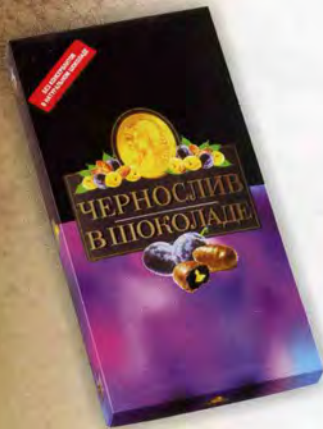
Чернослив в шоколаде с грецким орехом