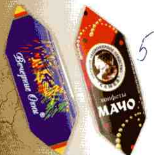
«Вечерние огни», «Мачо»

Трехслойная начинка из суфле, желе и бисквита в натуральной шоколадной глазури. Срок годности — 3 месяца