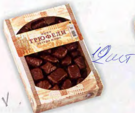
Трюфель ЭКСТРА ПЛЮС (мини)

Масса нетто 400 г Срок годности — 4 месяца