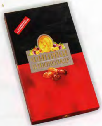
Финики в шоколаде