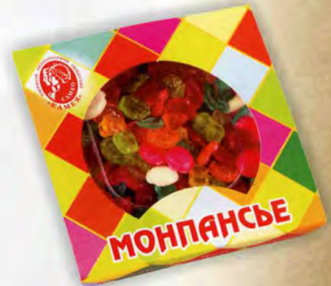
Монпансье ассорти фруктовое

Коробка пластиковая Масса нетто 200 г Срок годности — 6 месяцев