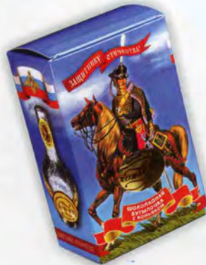
Упаковка День Защитника Отечества

Масса нетто 60 г, в т.ч. 20 г коньяка Срок годности — 2 месяца