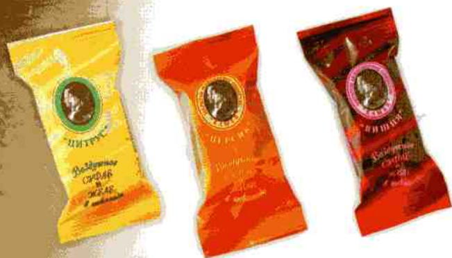
«Камея» Ассорти (цитрус, персик, вишня)

Двуслойная начинка из суфле и желе в натуральной шоколадной глазури. Срок годности — 4 месяца