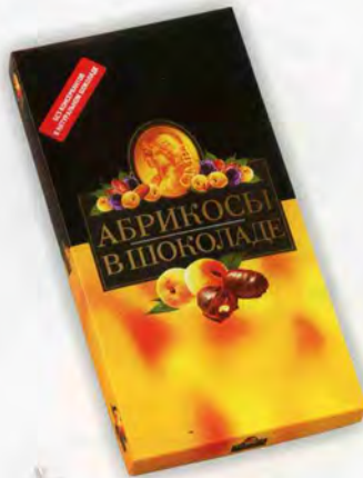
Абрикос в шоколаде с грецким орехом