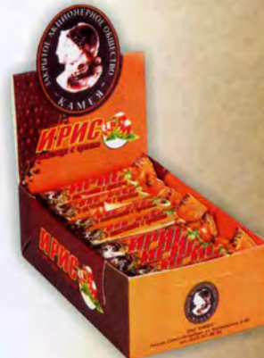
«Ирис сливочный с орехом в шоколаде»

Флоу-пак, масса нетто 42 г Шоу-бокс 24 шт.